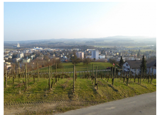
Blick auf Weinfelden