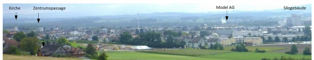
Überprüfung ortsbauliche Integration von höheren Häusern und Hochhäusern