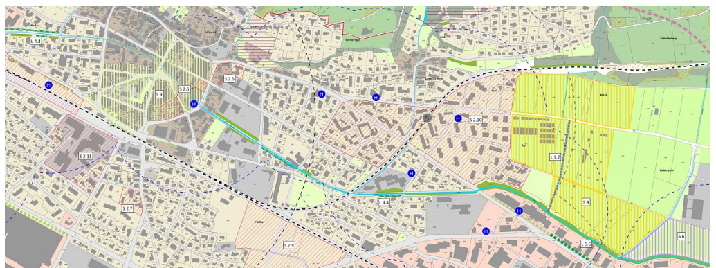
Ausschnitt Richtplan Auflageexemplar